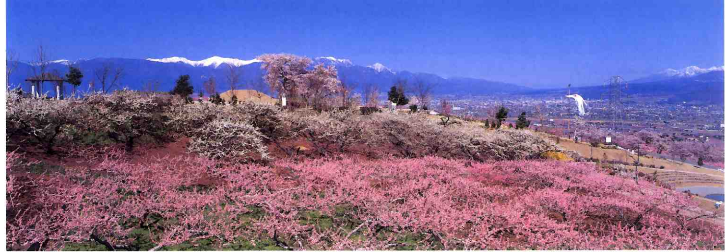
八代ふるさと公園