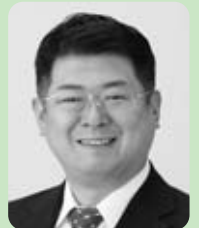
中川秀哉議員 (公明党)