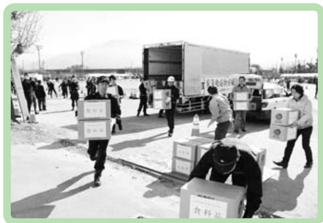
物資受け入れ訓練