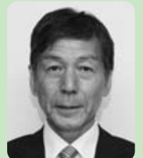
渡辺正秀議員 (日本共産党)