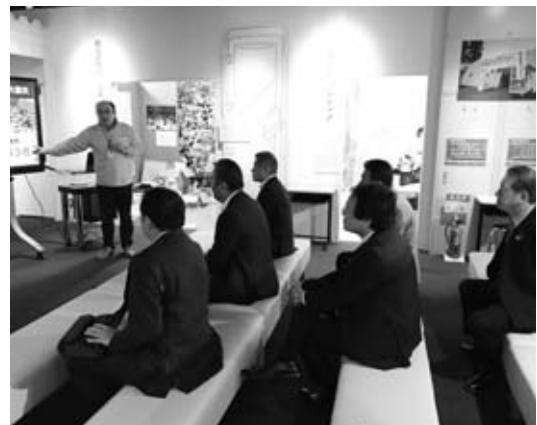
小千谷市「そなえ館」にて 中越地震の被災状況等の研修調査

平成30年も、国会議員との意見交換、市政に関する調査、将来を見据えた政策提言など、活動を進めていく予定です。