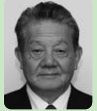
古屋始芳議員 (誠和会)