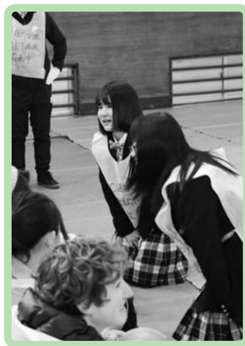
笛吹高校生による外国人旅行者の 通訳ボランティア