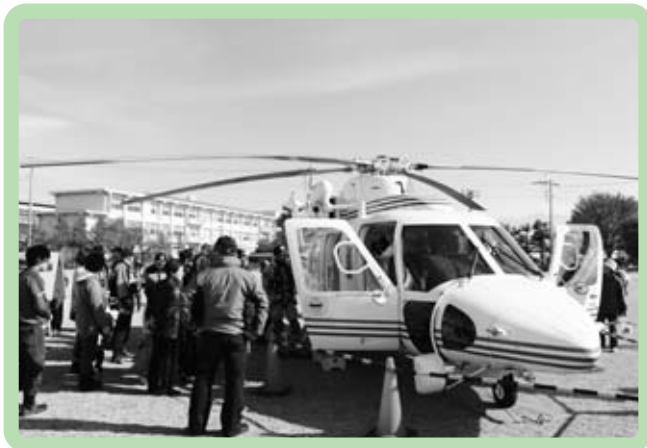
ヘリ展示「あかふじ」