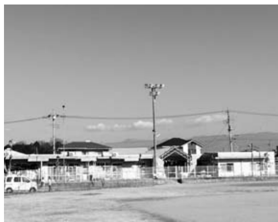
無償譲渡が審議された八代御所保育所