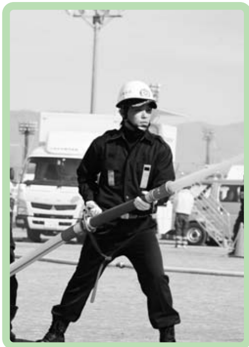
石和分団放水訓練