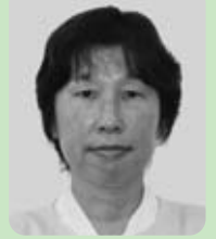
河野智子議員 (日本共産党)