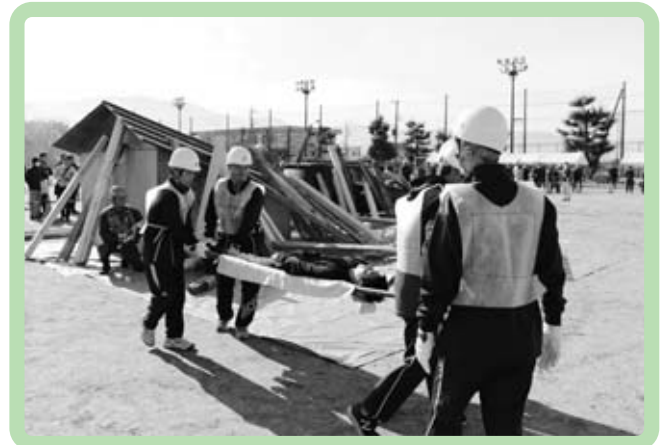
がれきからの救出訓練