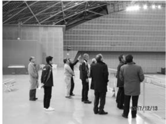
彩の国くまがやドーム

年に数回実施している先進地視察は、極力現在の市政課題に直結するテーマを決めて実施している。近年では、富山県や長野県の全天候型スポーツ施設、神戸市の震災復興の現実、茨城の鬼怒川水害復旧対応、埼玉県熊谷スポーツ施設等で視察研修した。