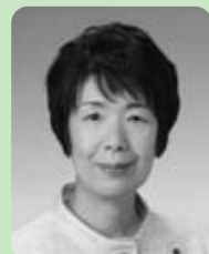
渡辺清美議員 (公明党)