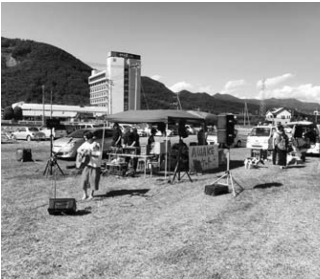
活用策を検討中の「笛吹みんなの広場」

④ 32年度までに、長寿命化計画を策定する予定。学校基本調査や住民基本台帳などから、35年度には230人ほど減少することが予想される。