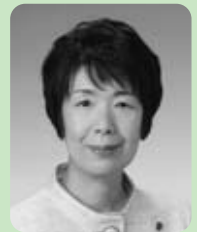
渡辺清美議員 (公明党)