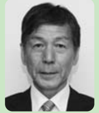
渡辺正秀議員 (日本共産党)