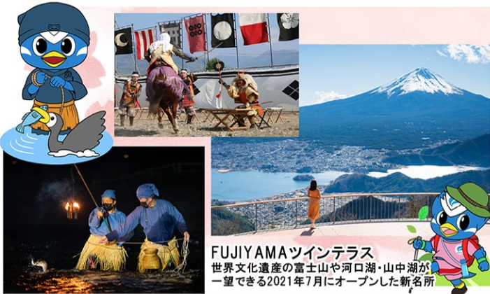
FUJIYAMAツインテラス 世界文化遺産の富士山や河口湖・山中湖が一望できる2021年7月にオープンした新名所

桃源郷春まつり ほたる祭り 笛吹川石和鞆餅 石和温泉花火大会 川中島古戦戦国絵巻 等たくさんのお祭り一年中楽しめるよ！