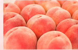
食桃 6月下旬～8月下旬 ベ巨峰 7月中旬～8月下旬 碩 ジャインマスカット8月下旬～9月下旬

笛吹市ってどんな所? 山梨県笛吹市は、都心からもアクセスが良い甲府盆地の東側に位置しています。日照時間が長いので、果樹栽培に適しており桃・葡萄の収穫・生産量は日本で一年中果物が豊富です。また全国屈指の温泉郷としても有名で 日本の桃源郷 と呼ばれています。