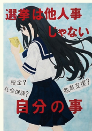
優秀 高戸 桜子(石和東小6年)