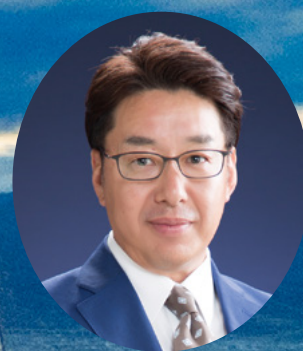
笛吹市長 山下 政樹