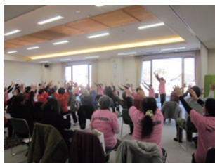
「シルバー体操指導員によるいきいき健康体操教室」の様子

1月16日(金)までに電話かFAXでお申し込みください。(氏名・地区名をお伝えください)