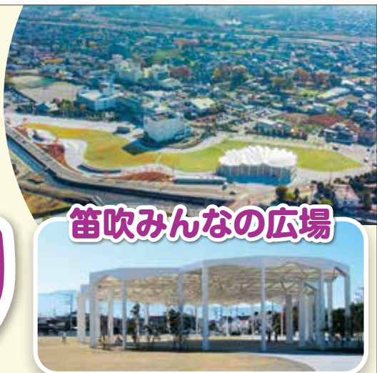
笛吹みんなの広場