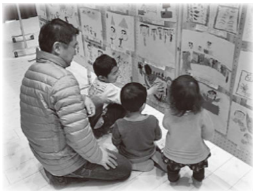
ポスターを眺める家族

1つ目は、市内の全保育所・保育園・幼稚園の年長組さんが描いたポスター「家族との楽しい思い出」展示です。年長組さんの児童517名が力いっぱい描いた絵はすばらしく、会場にぎやかになりました。今回だけの展示ではとても惜しい力作ぞろいでした。