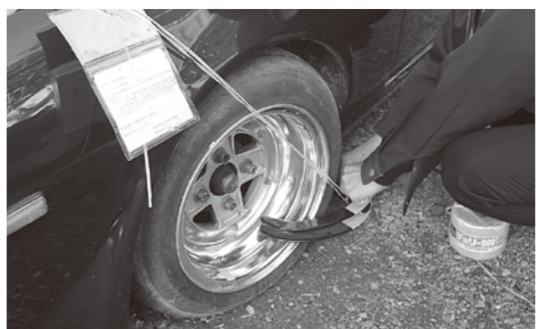
自動車差し押さえに係るタイヤロック

しています。税金を納期限までに納付せず滞納すると、本来納めるべき税金の他に延滞金を納めなければなりません。また、滞納者が税金を滞納したまま放置しておくと、法律に基づき、強制的に財産の差し押さえや公売などの滞納処分を受けることとなります。税金は納期限内に納付されますようお願いいたします。