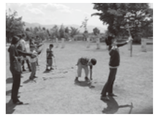
弓矢の的を射てみよう!

県立博物館では、毎年5月の大型連休にご家族揃って楽しめるイベントを開催し、皆さんをお待ちしています。 ▼日時 5月4日(日・祝)・5日(月・祝) ▼会場 体験学習室 ほか ▼内容 ○十二単と鎧を着てみよう! ○弓矢の的を射てみよう! ○草もちを作って食べよう!(5日のみ) ○オリジナル缶バッジを作ろう! ○あそぼう!まなぼう!寺子屋ひろば など ※事前申し込み不要、イベントにより当日受付(先着順・定員あり)を行います。観覧券が必要です(弓矢体験を除く)。 ※日時によって開催するイベントが異なります。詳しくは当館ホームページやチラシなどご確認ください。