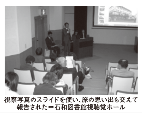
視察写真のスライドを使い、旅の思い出も交えて報告された=石和図書館視聴覚ホール

3月19日、ドイツ友好交流視察団報告会が実施されました。これは、昨年11月に、市民16名を主体とした視察団が、パート・メルゲントハイム市で産業振興などを視察してきたことから行われました。医師の指導によって飲泉の摂取が扱われるなど、温泉療養面での地域産業が発展していたことなど、熱い思いが発表されました。