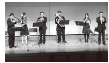
金管アンサンブルの音色をお楽しみください

県内の交響楽団や吹奏楽団でそれぞれ活躍しているメンバーによる金管五重奏団で、「金川の森」を練習の本拠地としています。