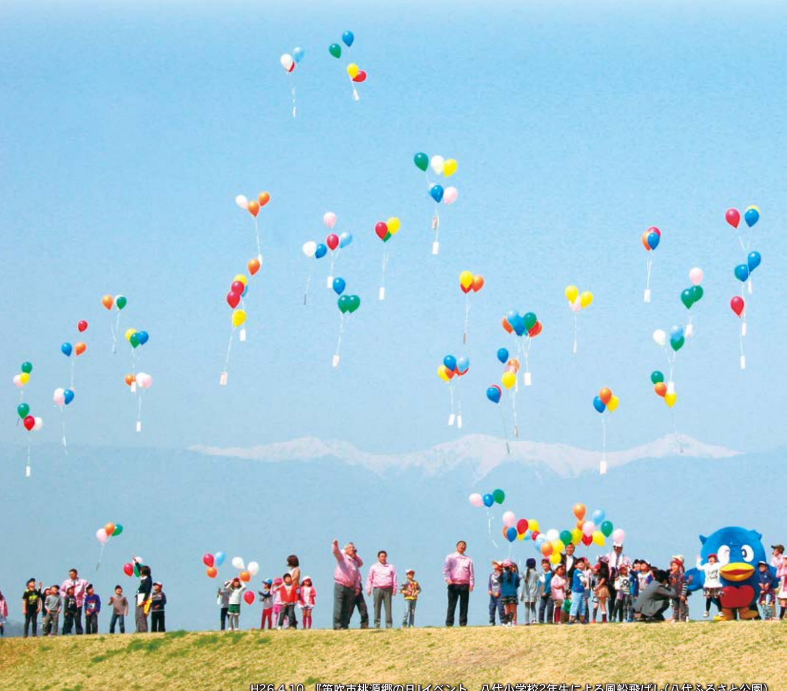
H26.4.10 『笛吹市桃源郷の日』イベント 八代小学校2年生による風船飛ばし(八代ふるさと公園)