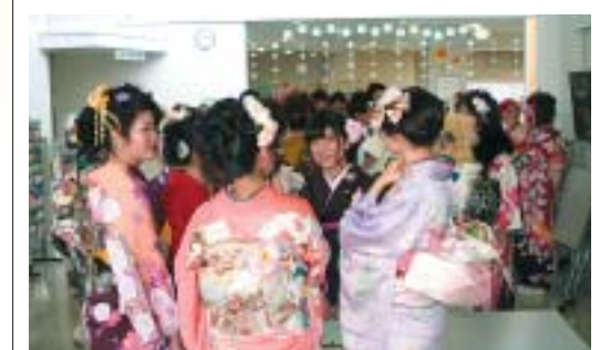
友人との再会に話が弾んでいました