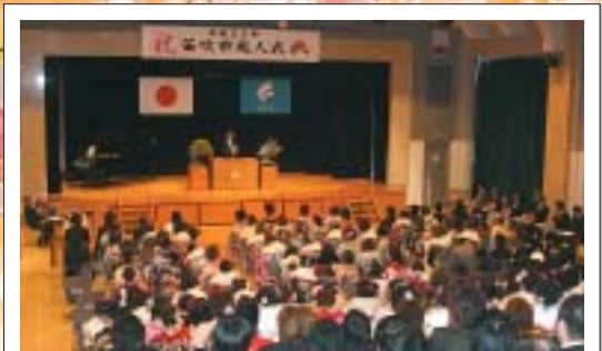
石和会場に208人が出席