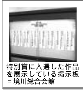
特別賞に入選した作品を展示している掲示板 = 境川総合会館