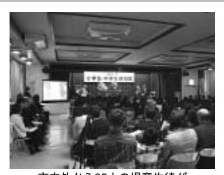
市内外から35人の児童生徒が参加した表彰式