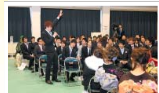
近況報告で目標を発表