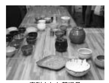
寄附された茶道具

八代町文化協会陶芸部 12月5日、八代町文化協会陶芸部は次の茶道具を浅川中学校に寄付しました。