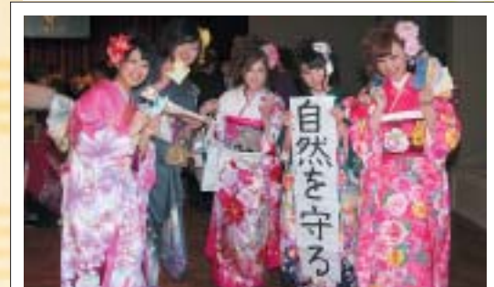
タイムカプセルから記念品を取り出した直後の一コマ