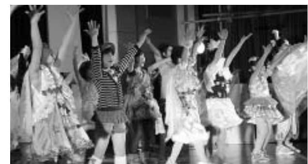
30人以上の団員が出演 = スコレーセンター