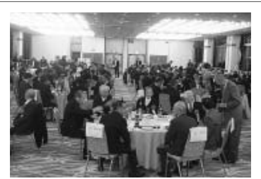
受章者を囲んでの新春交歓会