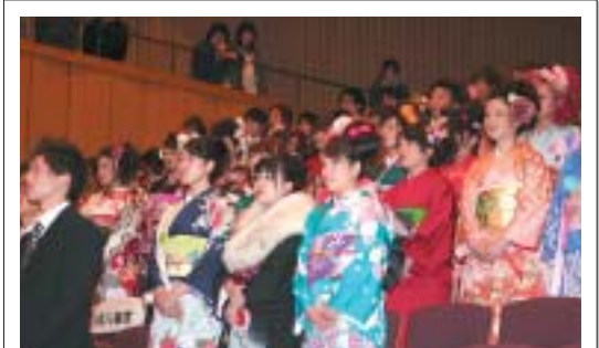
厳かな雰囲気の中で進行する式典