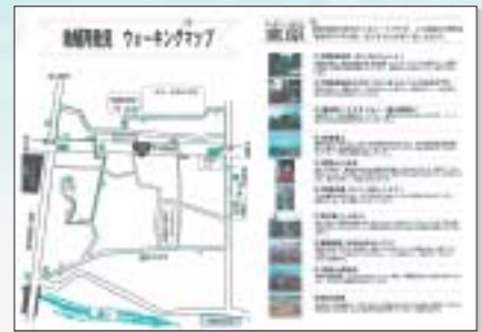
一宮地域のウォーキングマップを作成した「一宮町を考える会」