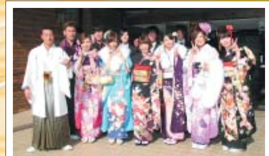
式典が始まる前に記念撮影をさせていただきました