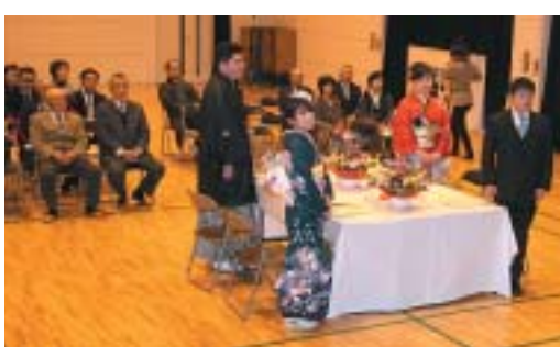
地域の方々に見守られる新成人4人