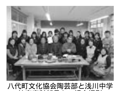
八代町文化協会陶芸部と浅川中学校家庭科部員との記念撮影