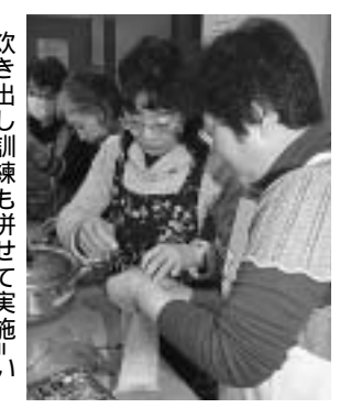
炊き出し訓練も併せて実施。いちのみや桃の里ふれあい文化館

12月6日、市赤十字奉仕団一宮分団と一宮地区民生委員児童委員協議会が合同で災害救護訓練を行いました。