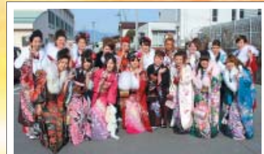
色とりどりの晴れ着姿もまぶしい新成人