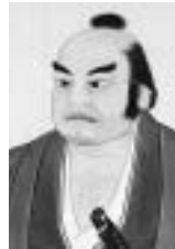
黒駒勝蔵肖像(称願寺蔵)