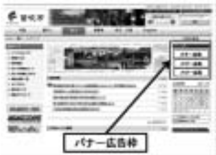
広告掲載イメージ《観光》ページ例 広告は右上に表示されます。

掲載期間 平成25年4月1日~平成26年3月31日 掲載ページ・掲載料(年額) 市政・暮らし・事業者 各7万円 観光 10万円 提出書類