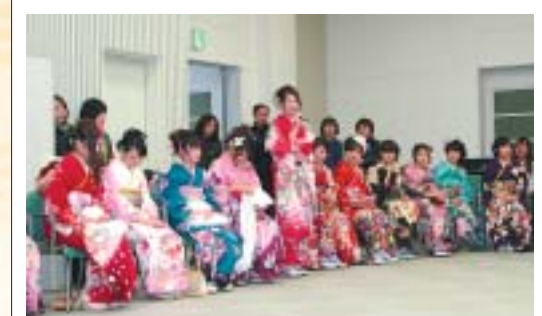
みんなで輪になって近況報告