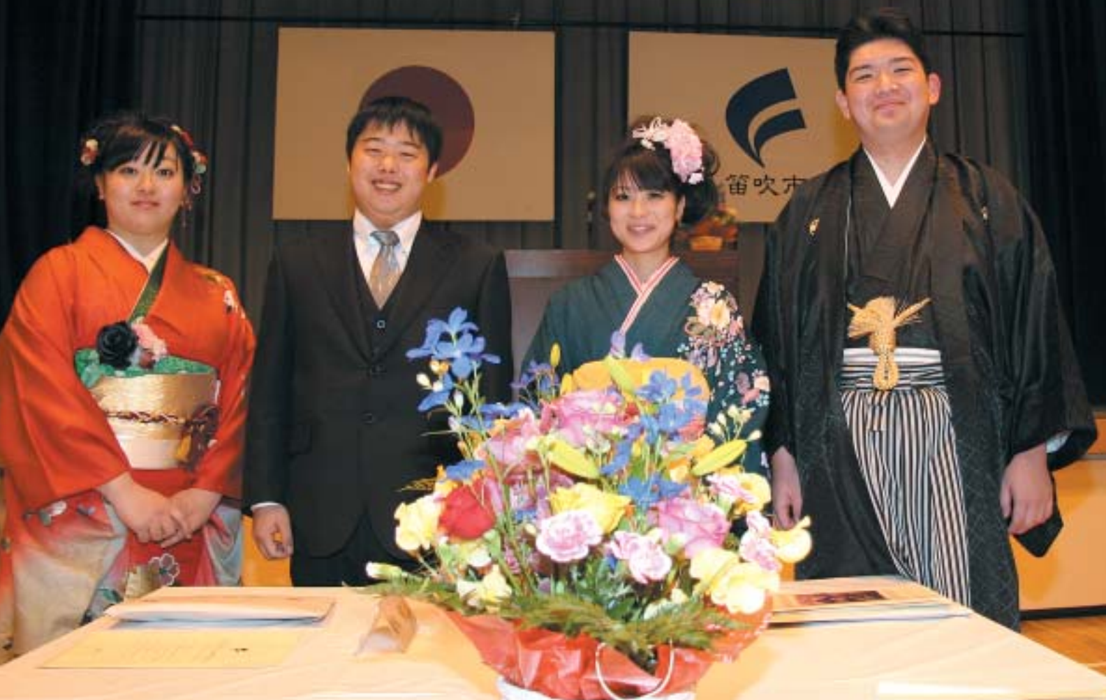
H25.1.13 平成25年笛吹市成人式（芦川ふるさと総合センター） 関連記事2ページ