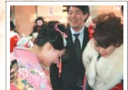
受付でなつかしい友人の名前を発見