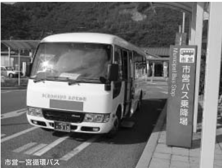
市営一宮循環バス