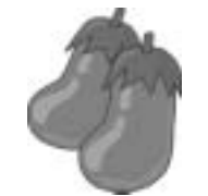
笛吹市の食材 なす

材料(4人分) なす...300g 砂糖...50g レモン汁...大さじ1 水...100ml レーズン...10g ラム酒...小さじ2 冷凍パイシート...2枚 シナモン...適量