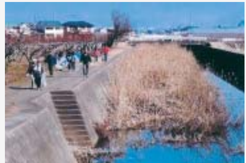
渋川沿いのごみ拾いをするなど、水害防止について啓発する「渋川の排水をよくする会」