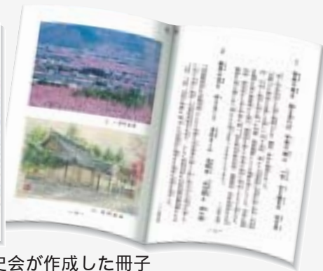
笛吹市一宮町郷土史会が作成した冊子 「甲斐の国一宮」の歌