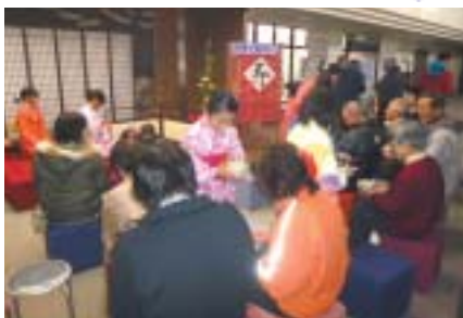
新春初釜 = スコレーセンター・ホワイエ

貸出・返却も1日で2千冊を超え、よいスタートができました。また、6日には一宮図書館で新春フェア・人間すごろくが行われました。美しい琴の音に酔いしれ、人間すごろくでは、親子そろってたくさんのお子様たちが参加してくれました。サイコロを振るたびに喜んだり、悔しがったりする姿が印象的でした。他にも用意した昔のあそびの羽子板やコマ回しにも興味津々でたくさん遊びました。