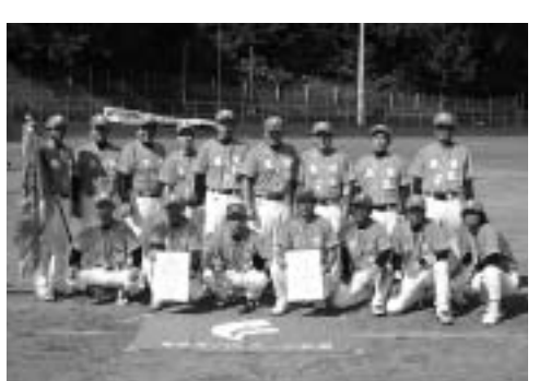
優勝を飾った笛吹Aチーム