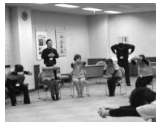
肩甲骨の動きを確認する受講者

健康で生きがいや役割があり、人生を悔いなく過ごせる高齢者が増えることをめざし、高齢体操指導員(シルバー体操指導員)を養成し5年目になります。シルバー体操指導員養成講座を修了した皆さんは、自主活動グループ「笛吹ストレッチクラブ」・「笛吹スマイルクラブ」・「笛吹いきいきクラブ」・「笛吹にこにこクラブ」をつくり、自分自身の健康づくりと体操の普及を行なっています。