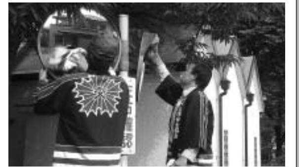
カーブミラーを磨く笛吹交通安全協会石和支部員

10月17日、笛吹交通安全協会石和支部の皆さんが、事業の一環として、石和町内に設置してあるカーブミラーの清掃を行いました。