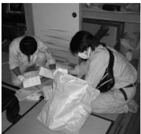
職員による滞納者宅搜索