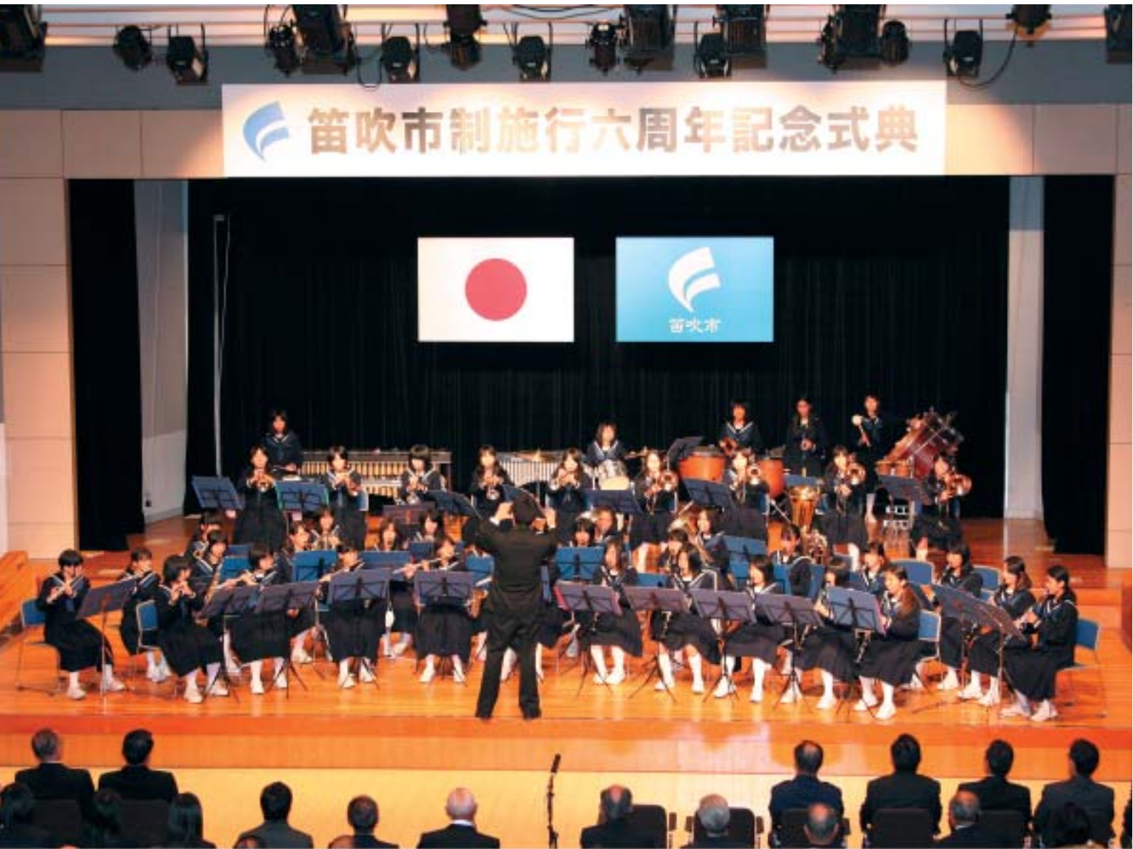
H22.10.12 笛吹市制施行6周年記念式典（スコレーセンター） 関連記事2ページ