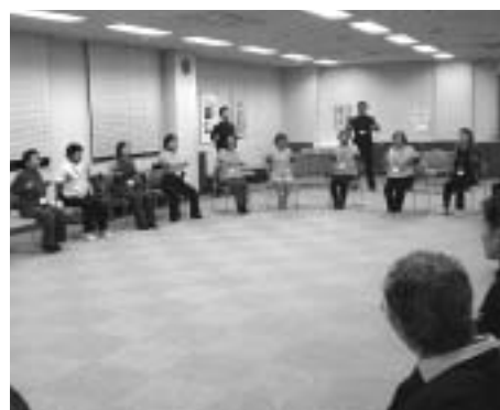
楽しくストレッチ体操を学ぶ受講者

シルバー体操指導員養成講座は、初級・中級・上級養成講座があります。中級・上級養成講座は、それぞれ初級・中級養成講座修了者が受講できます。初級養成講座はストレッチ体操を中心とした教室です。仲間づくりもできる、笑い声の絶えない楽しい講座です。受講希望の方、シルバー体操指導員の活動に興味のある方、シルバー体操指導員の講師の依頼は、お問い合わせください。