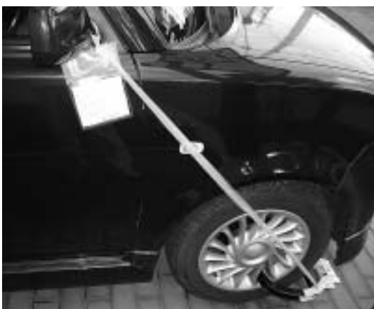
タイヤロックによる自動車の差押え

差押えの対象となる財産には、不動産、動産、自動車、給与、預金、生命保険等があり不動産公売やインターネット公売等により換価し、強制徴収します。