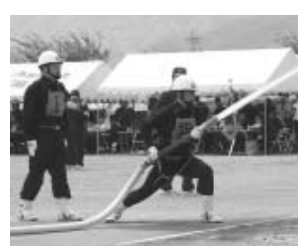
春日居分団による小型ポンプ操法