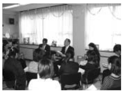
知事と意見交換をする参加者

10月22日、地域子育て支援センター「きつずいちのみや」のサークル室において、市内の子育てグループや実際に子育てをされている方などが出席し、知事との対話「県政ひざづめ談議」が開催されました。