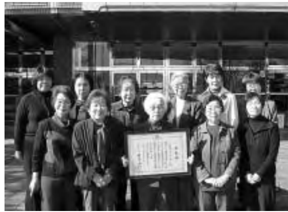
表彰された「あいあい」の皆さん

この「広報ふえふき」も、あいあいの皆さんほかボランティアの方々によって音訳され、視覚に障害のある方に届けられています。