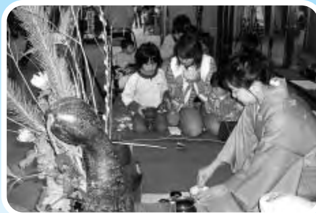
抹茶や琴演奏でお正月のひとときを