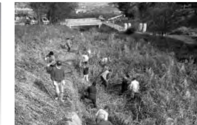
川の中には腰の高さほどのアシが

園児たちは、「山の感謝祭」の歌を元気に歌い、また、メッセージカードを添えたリンゴや柿を、「いつもお仕事をしてくださってありがとうございます。どうぞ食べてください」と職員に手渡しました。