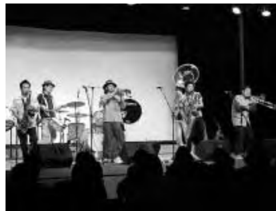
ブラック・ボトム・プラス・バンドの迫力ある演奏