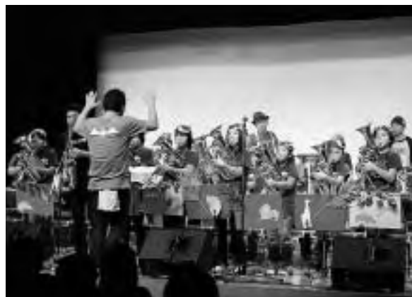
プロミュージシャンと共演する金管バンド

参加者は互いに協力しながら、2日間かけて、川の中約200メートル区間のアシを手作業で刈り取りました。