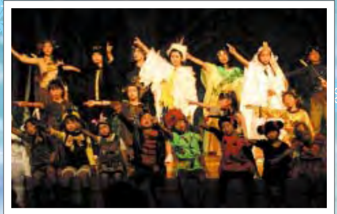
昨年の公演「ひみつの実」