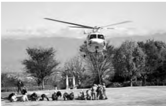
連携プレーで「あかふじ」へ給水