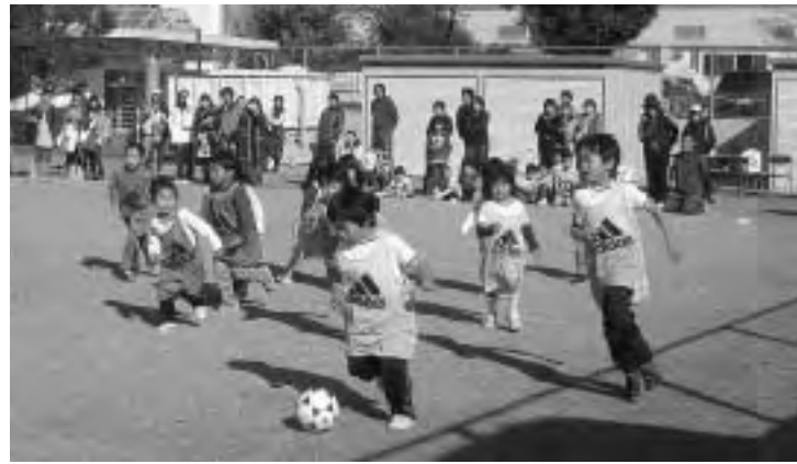
元気にボールを追う子どもたち