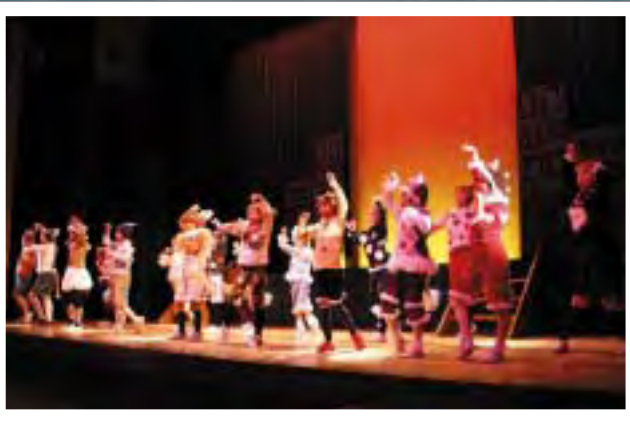
旗揚げ公演「ピアノマン」