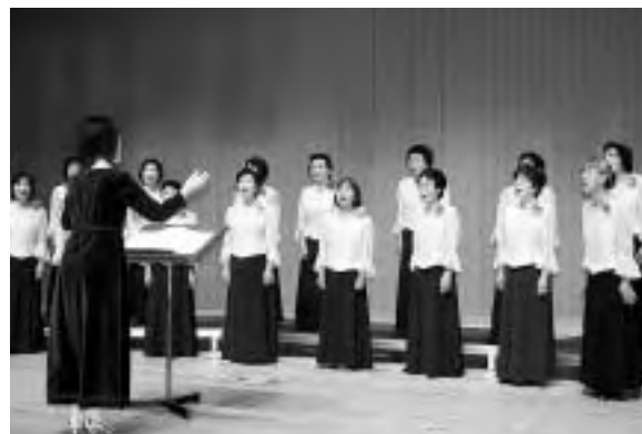
音楽部門発表会での合唱

会場では、笛吹市各文化協会員の力作の展示や成熟されたステージ発表など、多彩な催しが繰り広げられました。また、一宮町文化協会水石部により、富士山を思わせる自然石「富士山石」を展示した県下初の「富士山展」が開催され、訪れた人はその風情を楽しんでいました。