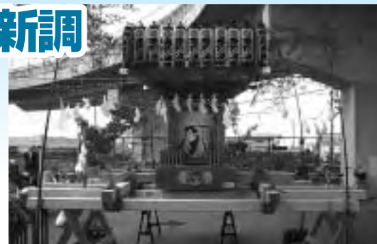
山岸区の新しいみこし