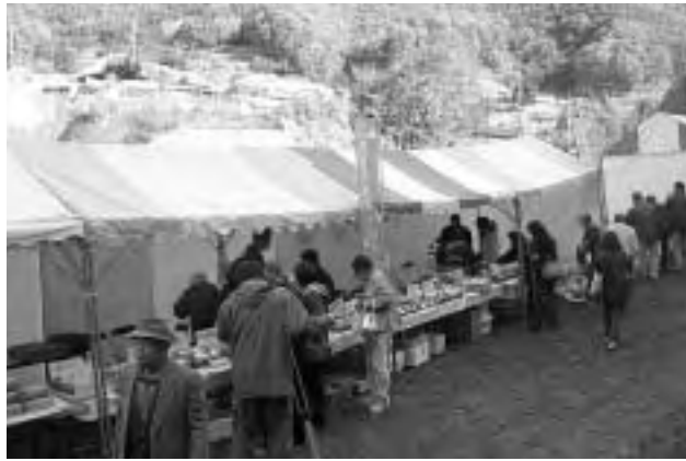
紅葉した山のふもとで開かれた収穫祭

この日は、家族連れなど約1000人が来場し、自然の恵みを味わいながら芦川町の秋を満喫。来場者は、「また次回の収穫祭にも来たいです」と話していました。