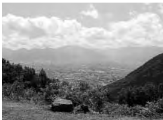
智の池から眺める甲府盆地

長谷寺の本尊は、秘仏(ひぶつ)のため普段は見ることができませんが、毎月第一日曜日午前10時から特別開帳しています。皆さんも山道を登り、長谷寺で静かな時間を過ごしてみたいかがですか。