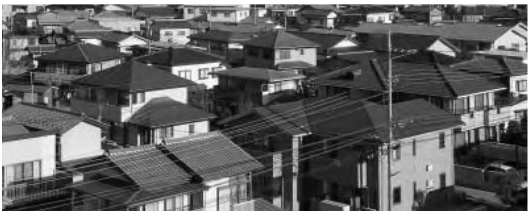
家屋について申告をお願いします