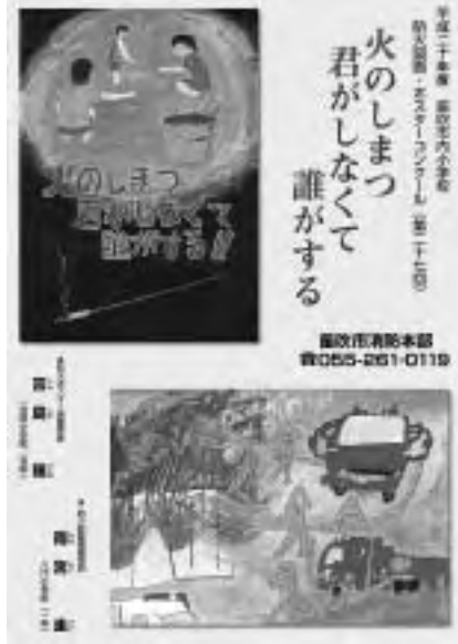
最優秀賞2作品はポスターに