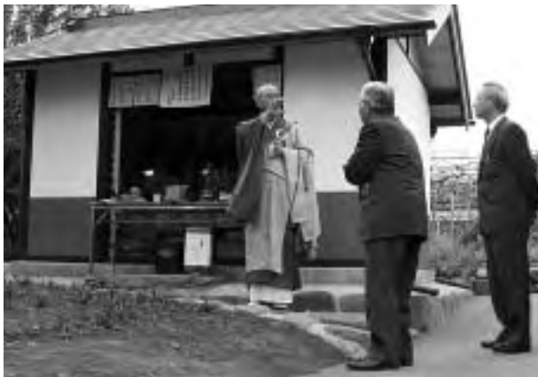
修復が完成した覆屋

五輪塔群を保存するために覆屋を建て、今回の工事では、老朽化した覆屋の修復を行いました。11月11日には、完成披露式典が行われ、かつての埋葬者の供養が営まれました。