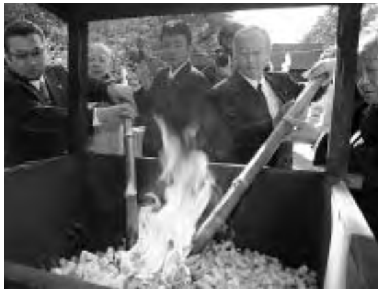
関係者によるおたき上げ

向山会長は、「ワイン産業を活性化させることで農業振興につなげたい」と感謝祭に込める思いを話していました。