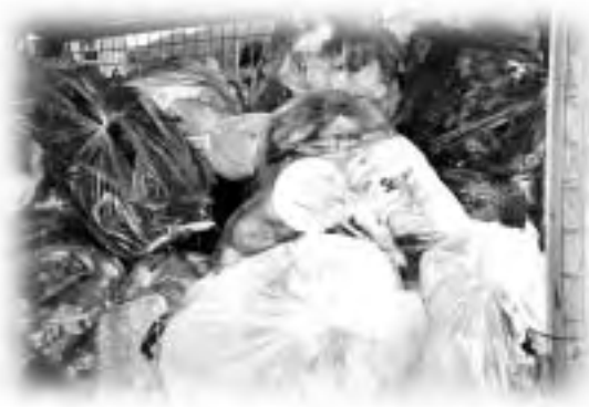
可燃ごみの中にたくさん混入していたその他プラスチックやミックスパーパー

10月21日、笛吹市女性団体連絡協議会では、市でごみ収集運搬を委託しているクリーンネット笛吹協業組合の収集車に乗り、市内のごみ集積場所を回りました。可燃ごみの中に、多くのペットボトルやミックスパーパーなどが分別されずに混入していました。燃やしてしまうと資源として生かされません。分別し、ごみを減らしていきましょう。