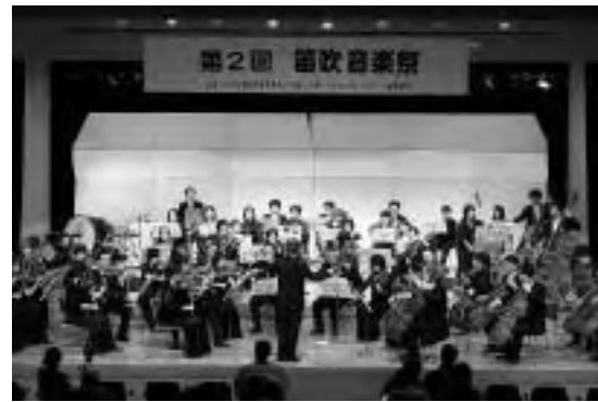
クライマックスのオーケストラコンサート

最終日には、プロ・アマが共に演奏するその日だけのオーケストラコンサートが行われ、演奏終了時には会場から大きな拍手と歓声が。来場者は、一期一会の音楽を堪能していました。