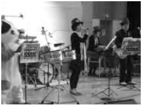
演奏と歌で楽しませた「ドリメロ ファンタジア」

参加した親子は、みんなで合唱したり、歌に合わせて体を動かしたりと、一緒にコンサートを楽しんでいました。