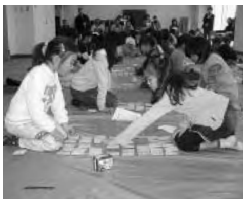
百人一首に熱中する子どもたち