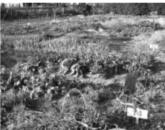
かすがいふれあい農園

問合せ先 みさかふれあい農園について 市御坂支所 地域課 055(262)2271 やつしろふれあい農園について 市八代支所 地域課 055(265)2111 かすがいふれあい農園について 市春日居支所 地域課 0553(26)3111 石和ミニ農園 産業観光部 農林振興課 農林経営担当 055(262)4111