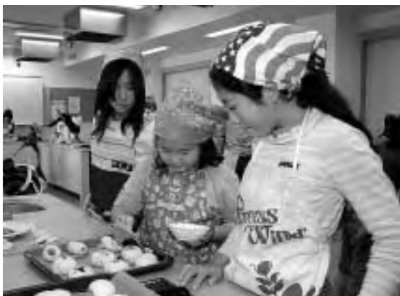
「楽しいね」友だちと一緒にパン作り

パンがこんがり焼き上がると、子どもたちはおいしそうにほおばって手作りの味を楽しんでいました。