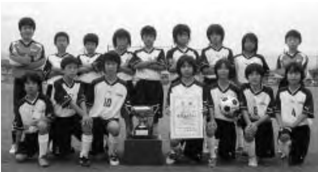
優勝を勝ち取った石和サッカースポーツ少年団

同チームの県大会優勝は、春季大会に続いての連覇で、秋季大会としては10年ぶり2回目（通算4回目）です。