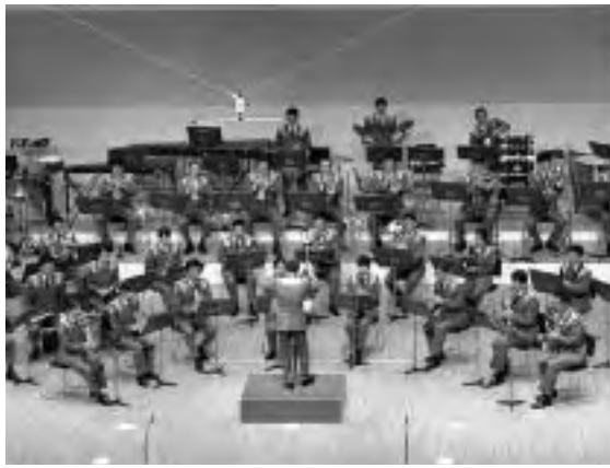
音楽隊が奏でる音色をお楽しみください