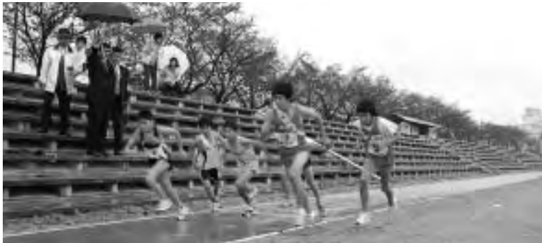
一斉にスタートする選手たち