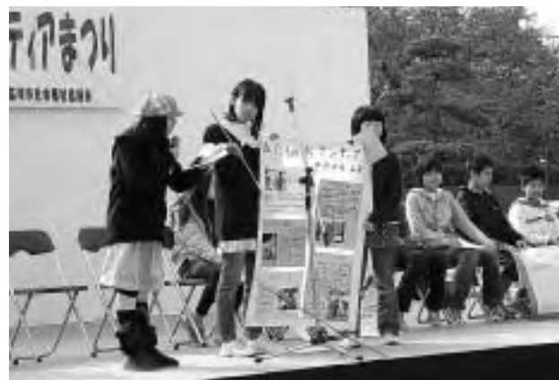
ボランティア活動を発表する小学生

会場では、ステージでのさまざまな発表のほか、ボランティア活動を紹介するコーナーやトランポリンなどの体験コーナー、各種模擬店のテントなどが軒を連ね、多くの来場者でにぎわいました。