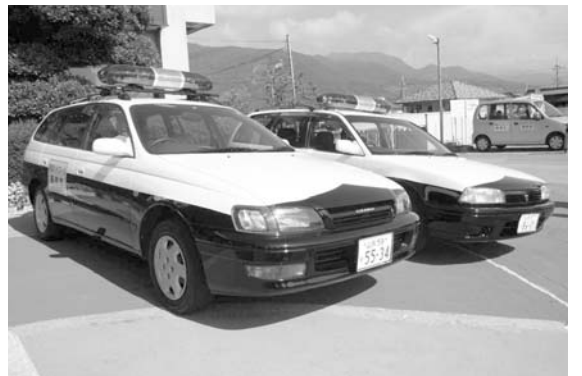
導入した青色防犯パトロールカー