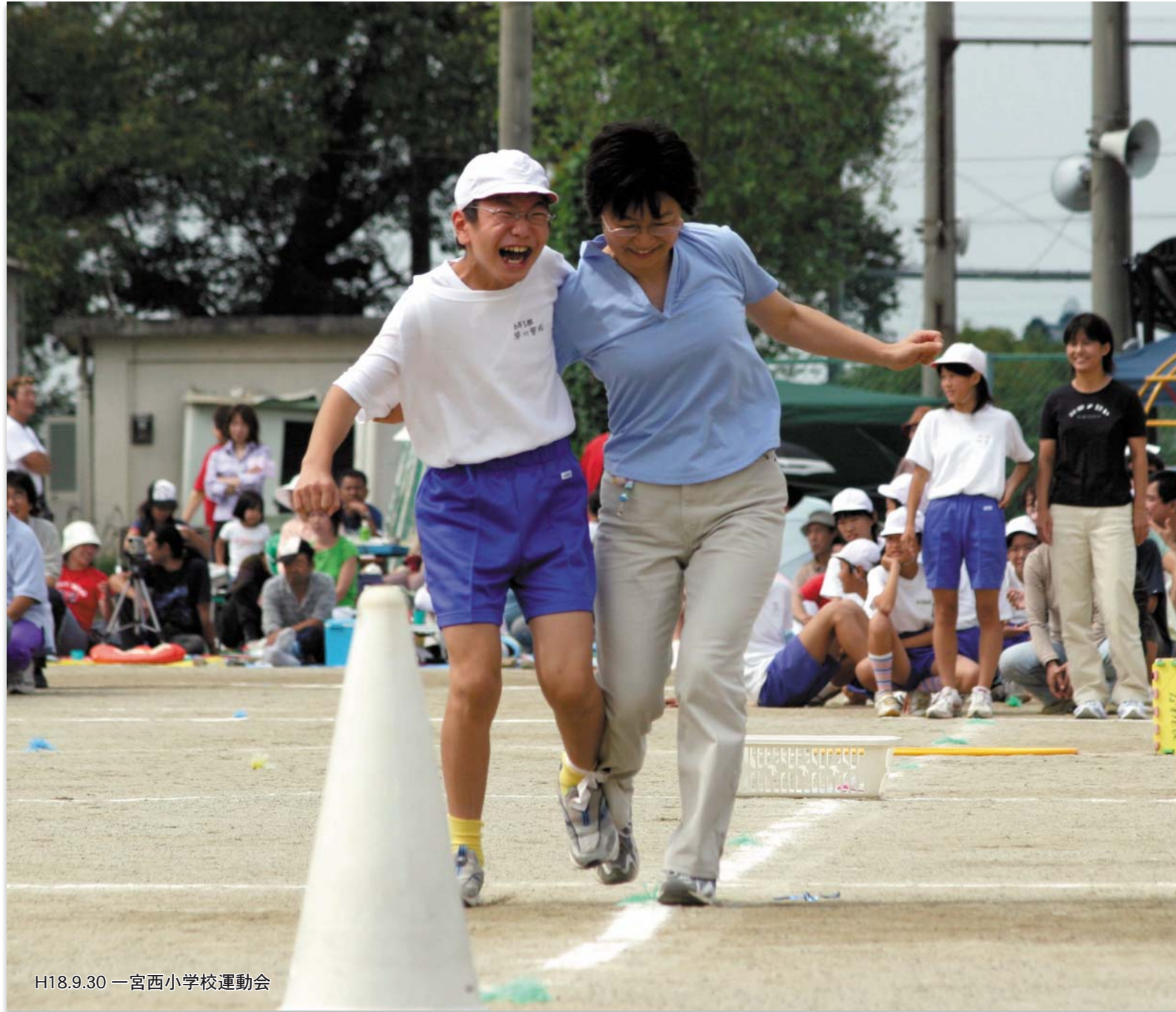
H18.9.30 一宮西小学校運動会