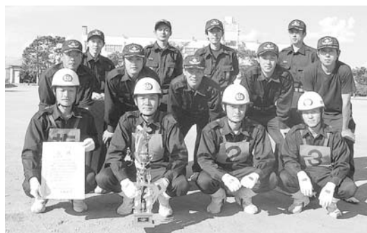
準優勝し賞状を手に喜ぶ御坂分団の選手たち