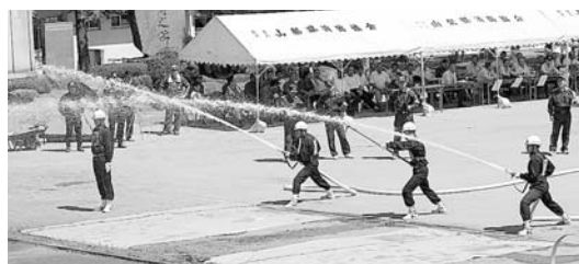
一宮分団によるポンプ車操法

9月10日、中央市の山梨県消防学校で第42回山梨県消防団員操法大会が開催されました。