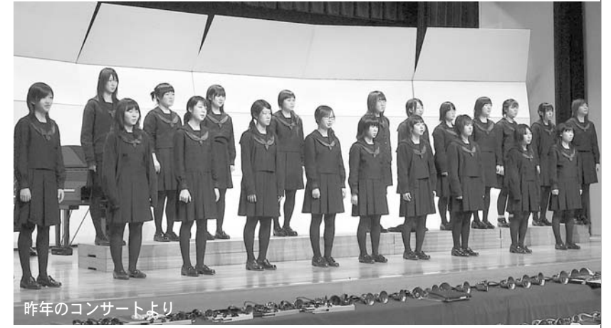
昨年のコンサートより

山梨英和高等学校聖歌隊によるハンドベルとコーラスのクリスマス・コンサートです。 ◎日時 平成18年12月16日(土) 午後3時開演(2時30分開場) ◎場所 笛吹市スコレーセンター集会室 ◎曲目 「愛のあいさつ」、「くるみ割り人形」他 ◎入場料 無料(入場整理券ご希望の方は、スコレーセンターまでおいでください。) ◎問合せ先 笛吹市スコレーセンター ☎055-263-7959