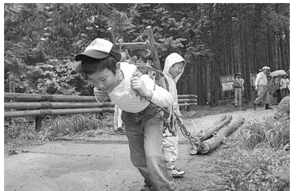
樹木の運搬体験をする児童