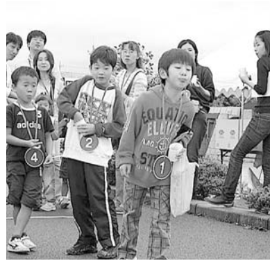
種飛ばし大会に参加した子どもたち

18日にはみさか桃源郷公園で、ワインやぶどうなどの特産品が当たる抽選会やぶどうの種飛ばし大会などが行われ、大勢の来場者で賑わいました。