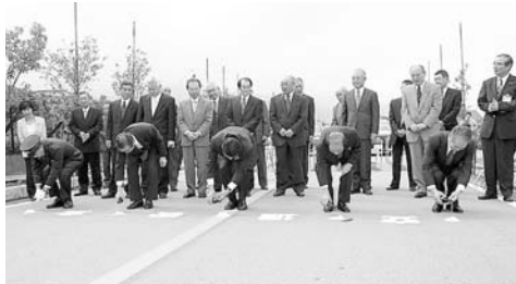
萩野市長(中央)ら関係者による「塩・酒清め」

この市道は全長が1460メートル。平成6年度から整備を進めてきたもので、市道と国道137号線の接続地点は中央自動車道一宮御坂インターチェンジに近いことから、交通の利便性が見込まれます。