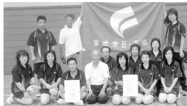
アベック優勝したバウンドテニスのメンバー

優勝種目 ソフトテニス男子、卓球男子、相撲、ラグビー、ライフル射撃、ゴルフ、バウンドテニス男女、ハンドボール女子