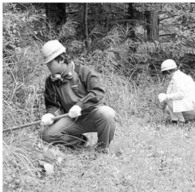
除草作業を行う参加者

今年度は、公募により選定した関東グロリアガス(株)ヤマビ事業本部が7月25日に笛吹市（締結時は芦川村）及び県と「環境保全林整備協定」を締結。第1回目となる当日は関係者40人が参加し、芦川町のすずらん群生地周辺の除草作業や看板設置などを行いました。