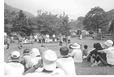
やまなし体指ふれあいウォーキング in 南部氏の郷

8月20日、南部町で平成18年度山梨県体育指導委員研修大会「やまなし体指ふれあいウォーキングin南部氏の郷」が開催され県下の体育指導委員が集まりました。この大会は、毎年行われている大会で、各地域を知り、それぞれの体指と共に関心・意見交換の中で勉強し地域の生涯スポーツ振興の活動に役立つものに役立てるものです。