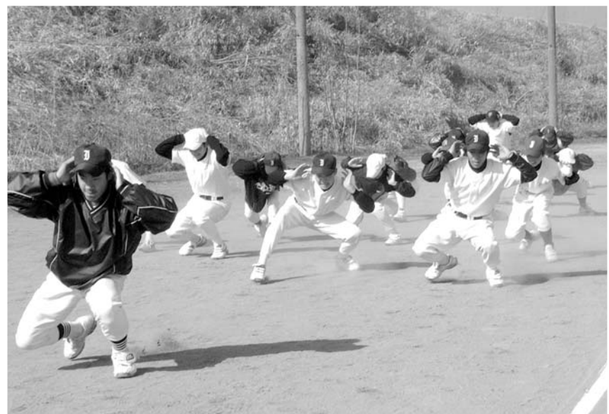
指導員と一緒に練習をする塾生