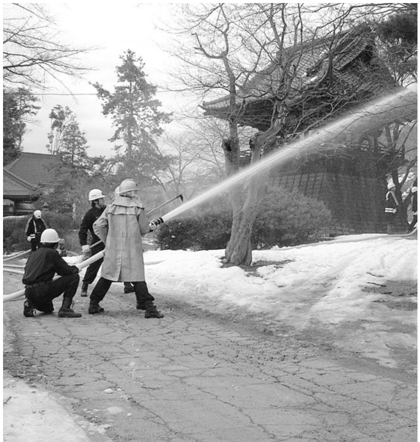
機敏な操作で放水する消防団員

なお、釈迦堂遺跡は昭和55年（56年、中央自動車道釈迦堂パーキングエリア建設の際に発掘調査された遺跡で、出土した鉄人形は、釈迦堂遺跡博物館で保管しています。