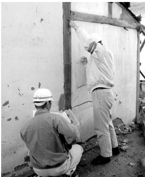
模擬訓練を行う参加者

東海地震を想定し、被災した際に応急危険度判定がスムーズに行えるとともに、応急危険度判定の技術向上を図ることが目的で、峡東振興局石和建設部が実施。訓練には、県建築士会石和支部員や市町村職員約50人が参加し、判定マニュアルの講習を行った後、JAふえふき岡部支所で、木造倉庫2棟を使い、傾斜やび割れなどをチェックしました。