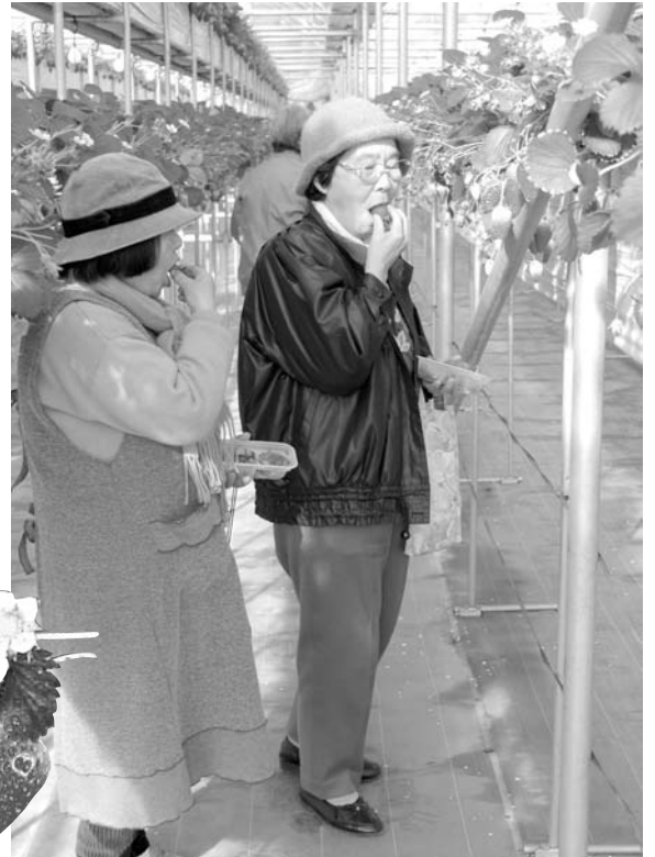
イチゴ狩りを楽しむ柏寿会のメンバー