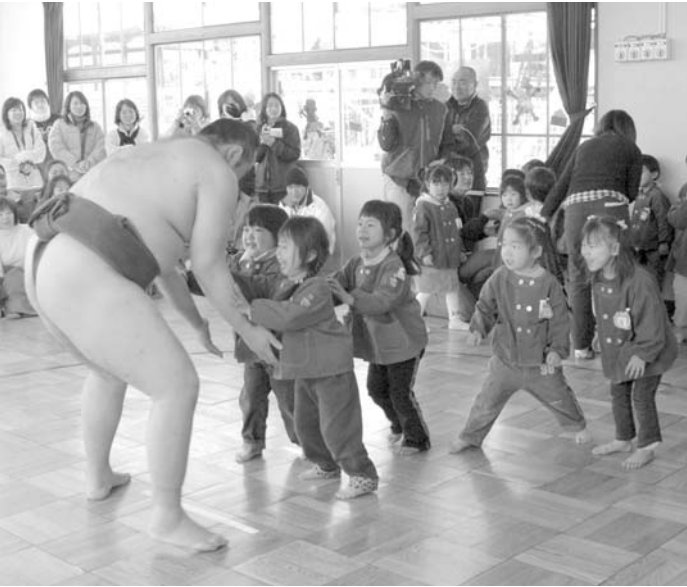
お相撲さんと園児が交流

2月3日、大相撲の中村部屋の力士3人が春日居町を訪れました。賀茂春日神社で節分の豆まきをしたあと、かすがい東保育所で園児たちと相撲を取り交流を深めました。