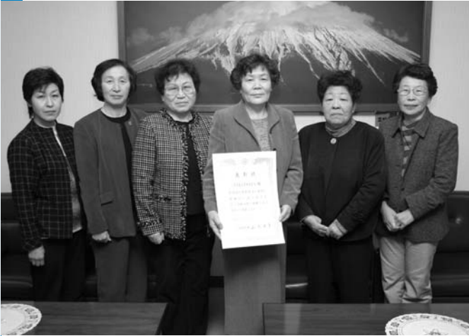
地産地消優良事例知事表彰を受けた八代特産品開発研究会のメンバー

2月18日、山梨県立文学館で「食のやまなし地産地消推進大会」が開催され、八代特産品開発研究会が地産地消優良事例知事表彰を受賞しました。八代特産品開発研究会は地元農産物を使った特産品を開発する目的で農家の主婦により発足。桃のシロップ漬けやなすの醤油煮、巨峰のジャムなどの商品開発や地元小中学校、福祉センターへ食材の提供を行い地元農産物に対する理解を深めてもらう活動などに取り組んでいます。