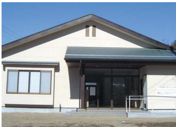
戸倉コミュニティーセンター