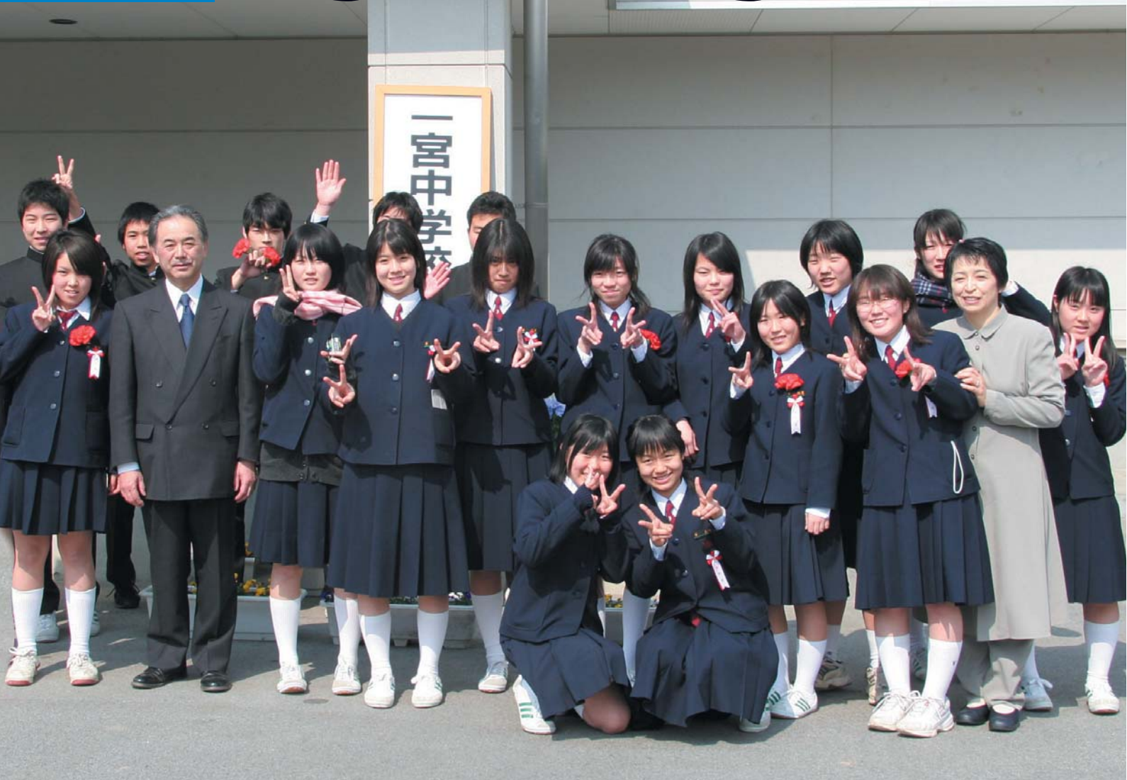
PHOTO H17.3.10 笛吹市立一宮中学校 卒業式にて