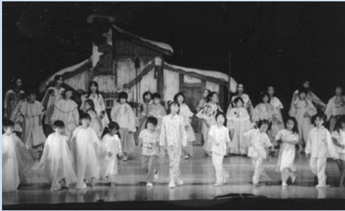
昨年のミュージカル「青い鳥」より

ミュージカル体験で豊かな感性や表現力を育むとともに、子ども達の心に残る思い出づくりをしませんか? 演題はご存知「ピノキオ」。笑いあり、涙ありの歌と踊りの楽しいミュージカルです。「劇団フジ」の監督さんや団員が、歌や踊り、せりふの指導をおこないます。経験の有無は問いませんので、是非ご参加ください。(無料です。)