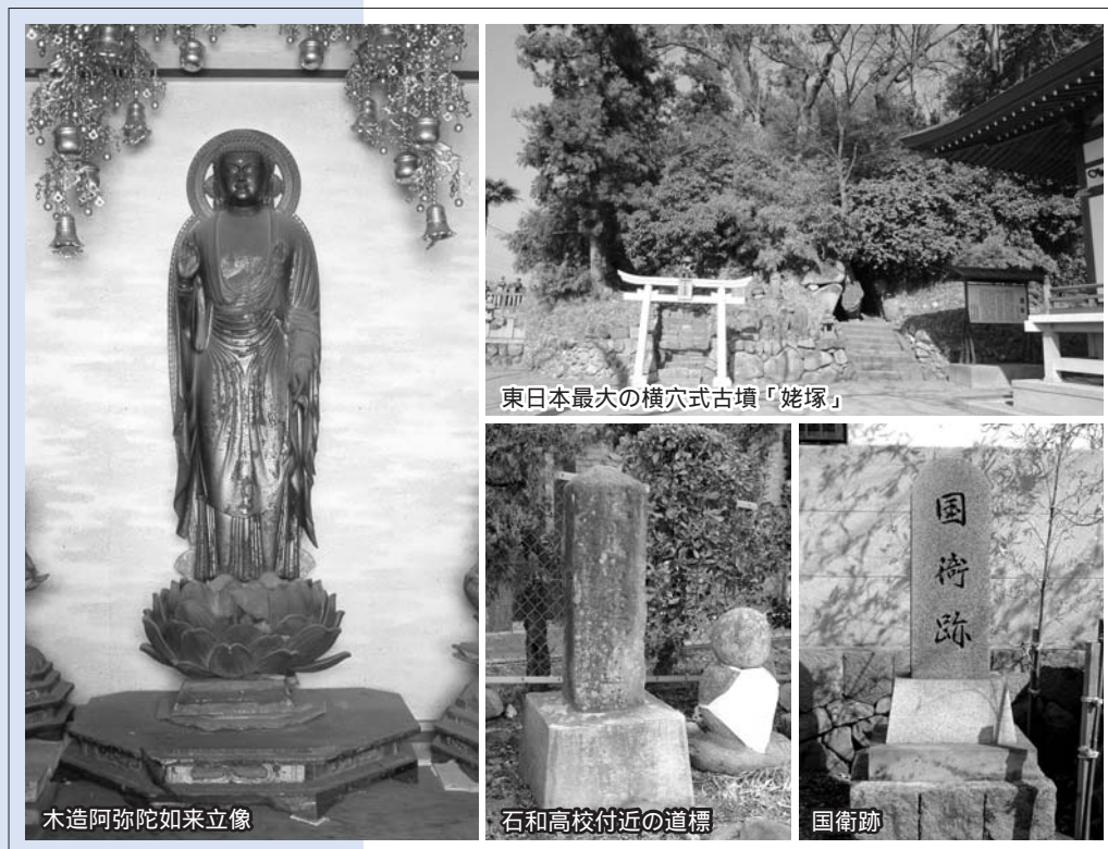
木造阿弥陀如来立像