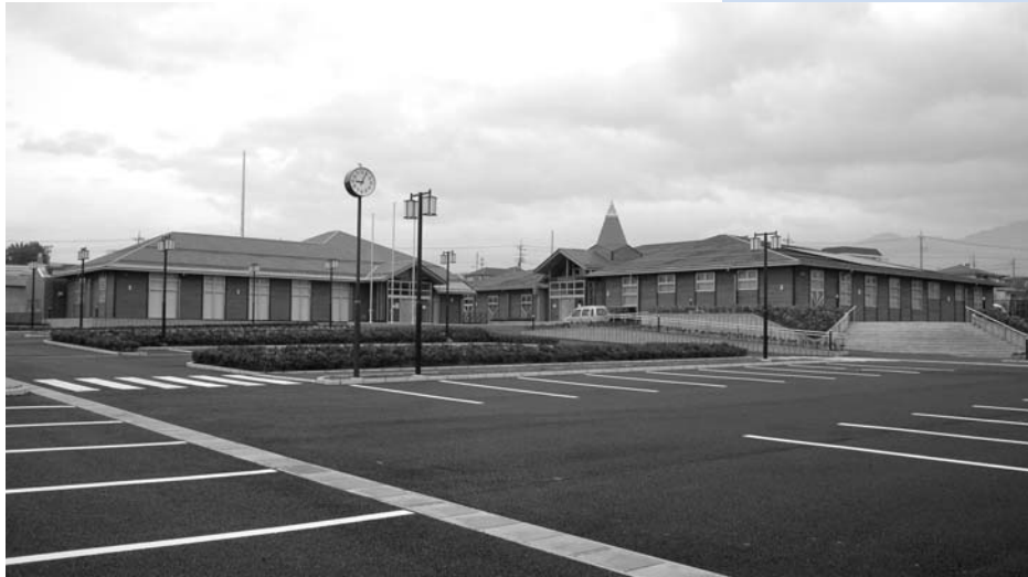
完成した「学びの杜みさか」(右)と「御坂支所」

3月10日、生涯学習センター「学びの杜みさか」と笛吹市役所御坂支所が御坂町夏目原地区に完成し竣工式が行われました。生涯学習センター「学びの杜みさか」は御坂地区の生涯学習の拠点として整備され、高齢者や障害者に優しく、環境に配慮した施設で構造を含めて県産材を使用し木造平屋建てです。