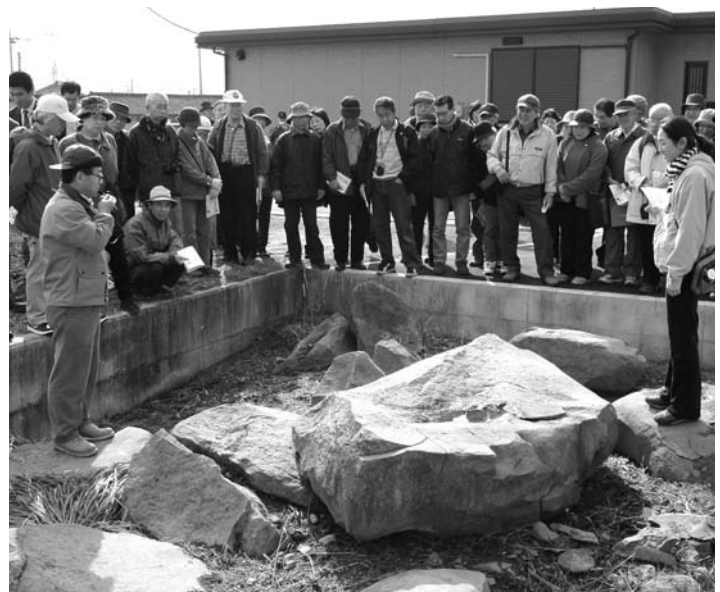
大蔵経寺前古墳群(石室)の説明を聞く参加者(石和地内)