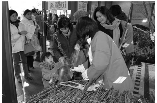
桃の花を受け取る親子

2日は、一宮観光協会会員が横浜駅西口で首都圏の人たちに桃の花6000束をプレゼント。桃の花を手にした大勢の人たちは、桃の節句でもあるこの時期の春の便りを喜んでいました。