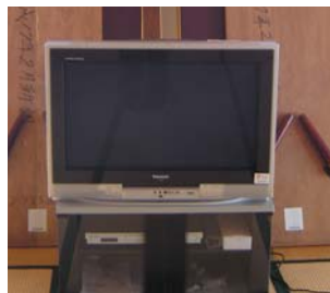
尾山区公民館備品