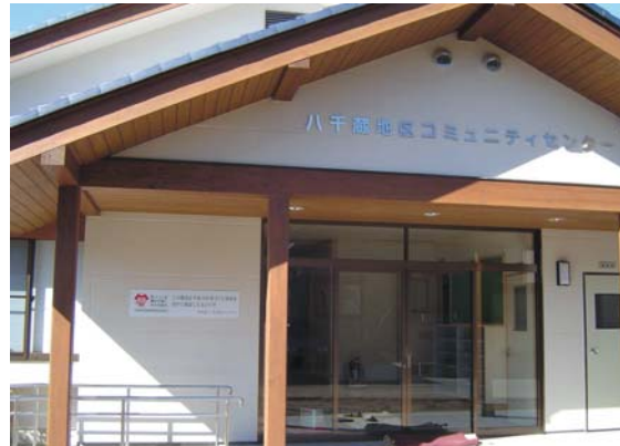
八千蔵コミュニティーセンター