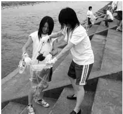
ゴミを拾う石和高校の生徒

6月24日、石和高校の生徒が奉仕活動を行いました。この日は全校生徒が参加。鵜飼橋から石和橋までの笛吹川河川敷の河川清掃を行いました。