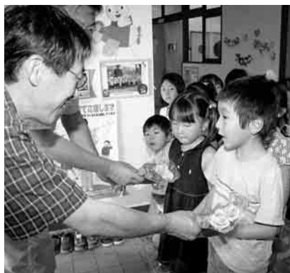
葵保育所の園児にバラをプレゼント

6月17日、JA笛吹御坂バラ部のメンバーが御坂地区内5つの保育園を訪れ、園児にバラの花束をプレゼントしました。園児が父の日にバラの花束をお父さんに贈ってもらえるようにと毎年行われています。