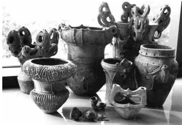
釈迦堂遺跡から出土した土器類

このほか、この地域特有の立体的な装飾のある縄文土器も大量に見つかりました。その量20トン。うち1200点がこれまでに復元されました。水が曲線を描いて流れる様子に似た模様、渦巻き、へび模様、踊る人の模様など、土器の表面で重なる模様の束は、縄文人の見たものや感じたことを表現しているのでしょうか。実に多様な模様が美しく並びます。