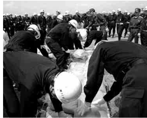
土嚢を積み上げる消防団員

6月4日、笛吹市水防訓練が市役所前の笛吹川河川敷で開催されました。訓練には笛吹市消防団や東八消防本部などから約400人が参加。水害対策技術として積土嚢、木流し、三角棒、シート張りの訓練が行われました。