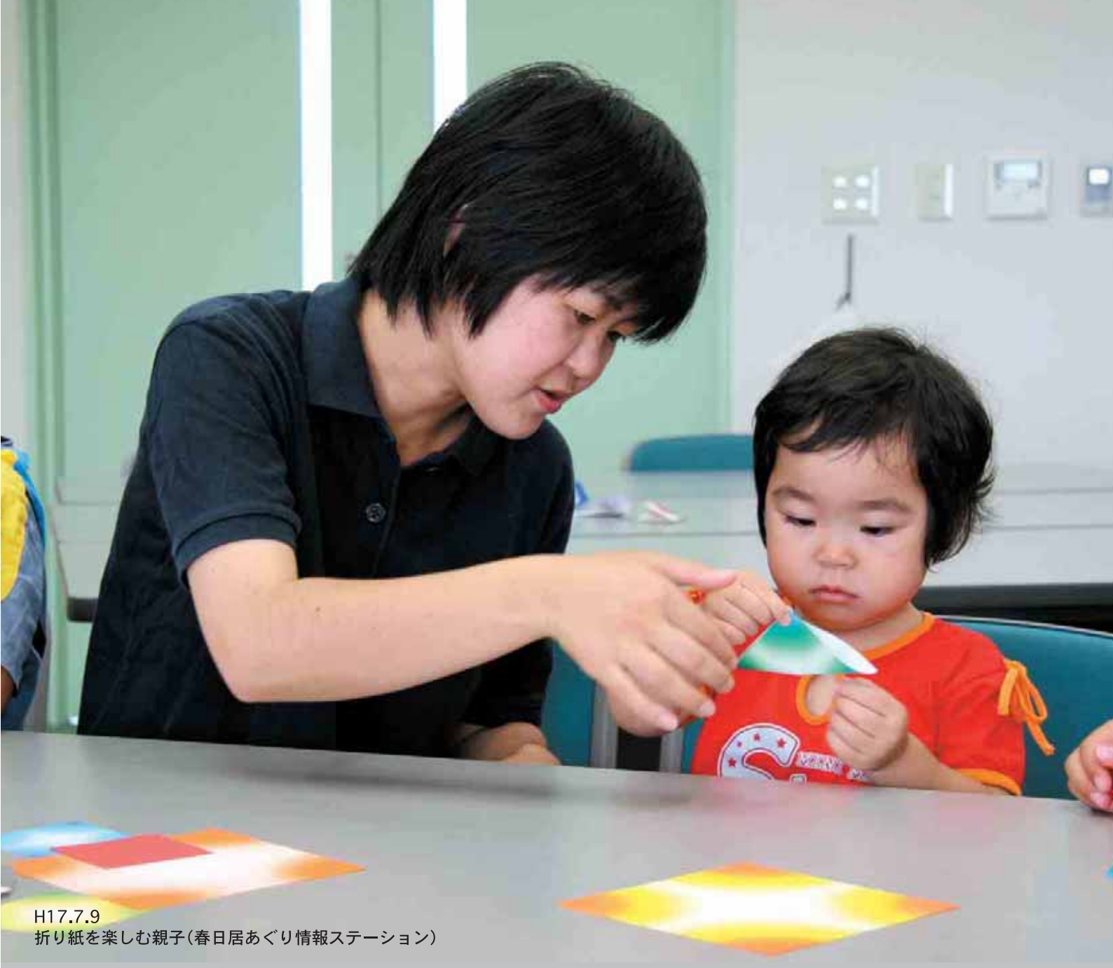
H17.7.9 折り紙を楽しむ親子(春日居あぐり情報ステーション)