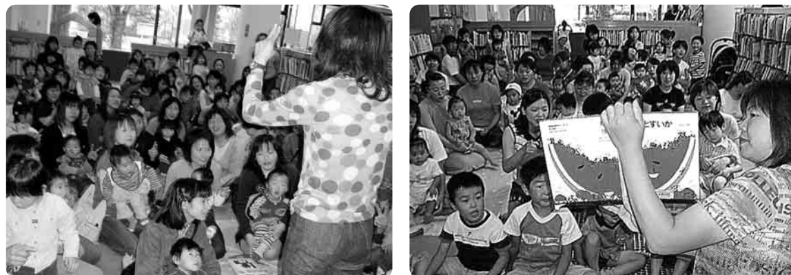
おはなし会の様子

お陰さまで、タンタンの活動も10年が過ぎようとしています。図書館で子育て支援を行う中で、いろいろな方と出会いさまざまなことを学ばせていただきました。始めの頃のおはなし会は、わずか1・2組の親子だったのが現在は毎回40から50組の親子が参加してくださいます。 また、なかなか本の読み聞かせも落ち着いて聞けなかった子どもも、タンタン卒業(卒タン)の頃になるとじっとお話が聞けるようになります。中でも、あるお母さんから、「タンタンがある日は、子どもが楽しみでいつもよりご飯を食べたり、お出かけの支度をスムーズにしてくれるくらい影響があるのですよ。」「小学生になった子どもがタンタンを覚えていて妹にタンタンのおはなし会を真似してやるんですよ。」「……と嬉しい感想もたくさん寄せてくださいます。 子どもたちの成長を見て、タンタン・職員一同大きな喜びを感じています。これからも、おはなし会タンタンで本の楽しさ・本を通して親子のスキンシップの大切さを伝えていきたいと思っています。 今後ともよろしくお願ひします。 (タンタン・職員一同)