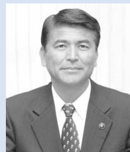
笛吹市長 荻野正直

11月14日に行われた笛吹市長選挙で、初代の笛吹市長に荻野正直氏（石和町井戸）、笛吹市議会議員一般選挙で、新議員30人が誕生。翌15日には、荻野市長並びに議員に当選証書が附与されました。16日の初登庁では、市長記章をつけた荻野市長を職員が拍手で出迎え、荻野市政がスタートしました。なお、この選挙の投票率は79.58%でした。