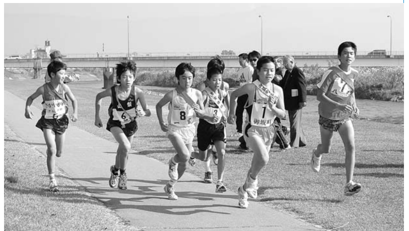
市役所前を一齐にスタートする第1区のランナー(小学生男子)