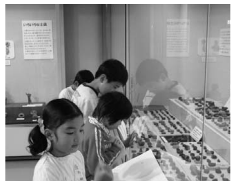
まなざしー土偶の見た風景

また、「子どもたちの創造力のひるば」では、勝沼町と笛吹市（旧一宮町）の小学生が描いた縄文時代の人の姿の想像図なども展示されました。