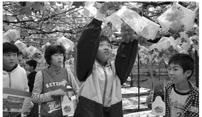
ぶどう狩を楽しむ那古小学校の児童

11月5日、花鳥の里スポーツ広場において東八代地区農業委員会グラウンドゴルフ大会が開催されました。笛吹市からは83人の農業委員が参加し、東八代郡下の農業委員と親睦を深めました。また、笛吹市農業委員会では、新潟中越地震の被災者へ8万3千円の義援金を贈りました。