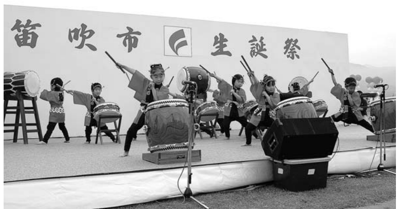
太鼓の演奏を披露する保育園児

このイベントは、新市住民の触れ合いを深めようと東八青年会議所が企画したもので、記念音楽祭では、市内の保育園やサークルなどが参加。和太鼓やマーチングの演奏などを披露し、会場に詰めかけた市民からは大きな拍手が送られていました。