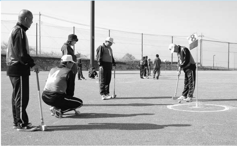
秋晴れの下親睦を深めた大会