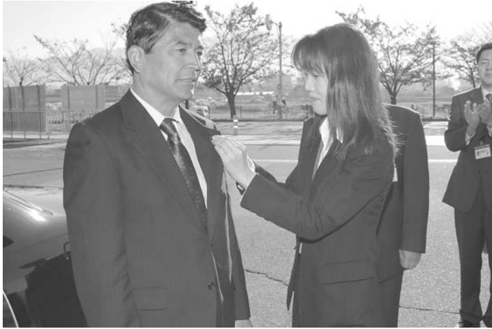
市長記章を胸に初登庁