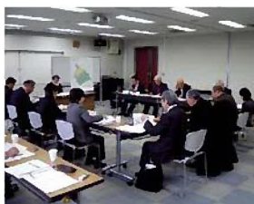
・ 第 1 回策定委員会