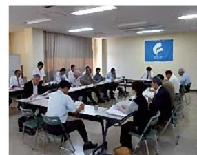
・ 第 4 回策定委員会