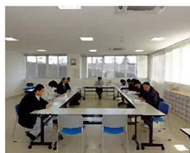
・ 第 4 回庁内検討委員会