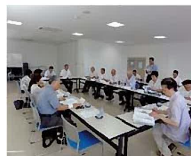
・ 第 3 回策定委員会