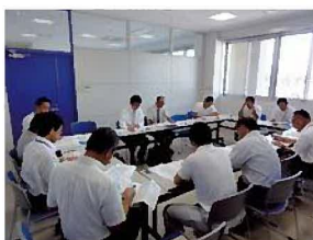
・ 第 2 回庁内検討委員会