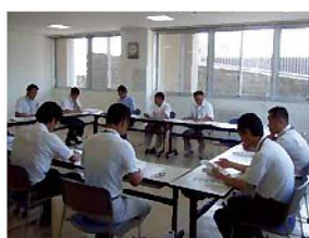
・ 第 3 回庁内検討委員会