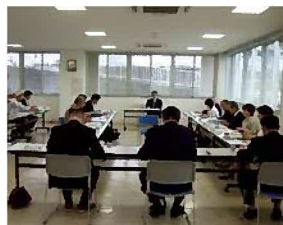
・ 第 2 回策定委員会