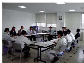
・ 第 1 回庁内検討委員会