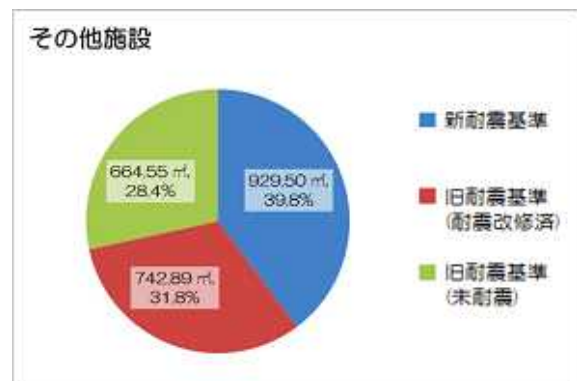
図 2-100 耐震化の状況