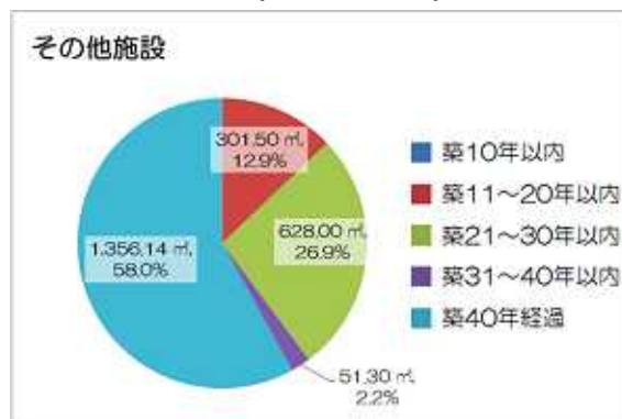
図 2-99 建物の築年数別の割合

耐震化の状況は、9 棟のうち 4 棟が木造で、60.2%が旧耐震基準であり未耐震が 28.4%となっています。（図 2-100）