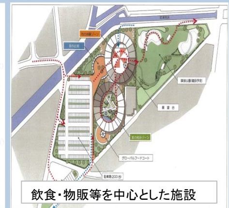
飲食・物販等を中心とした施設