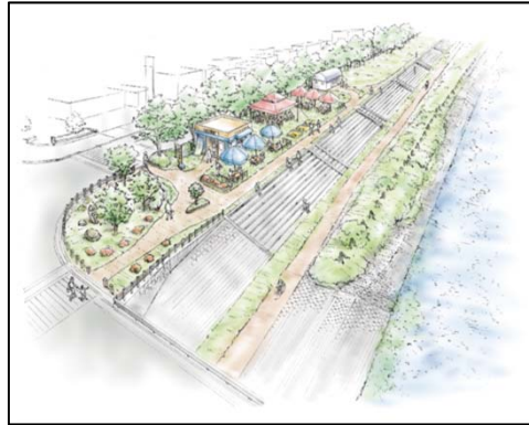
親水護岸・オープンカフェ