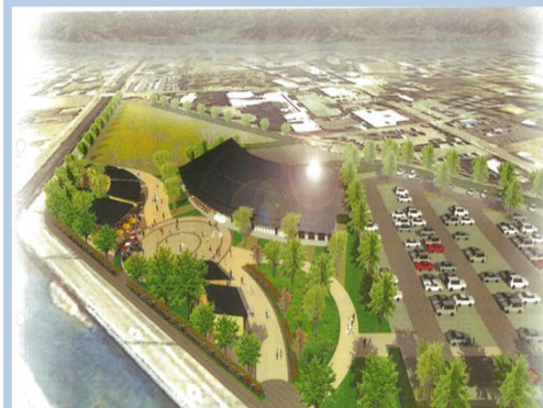
芸能人ミュージアムを中心とした施設