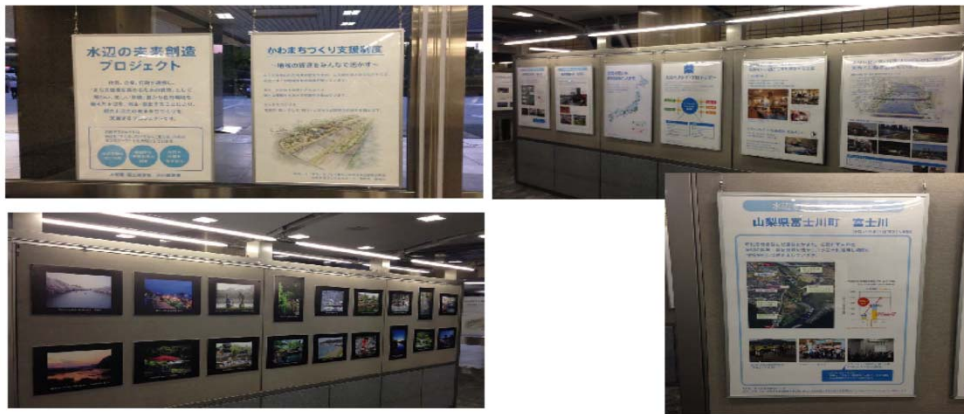
国土交通省にて笛吹市のミズベリングの取り組みが紹介されました