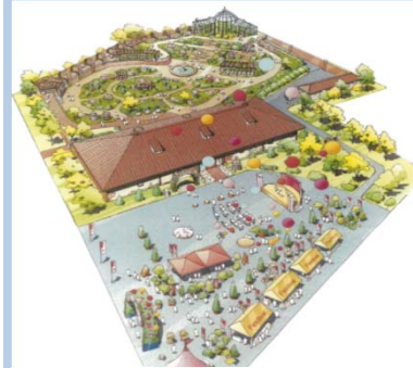
バラ園を中心とした施設