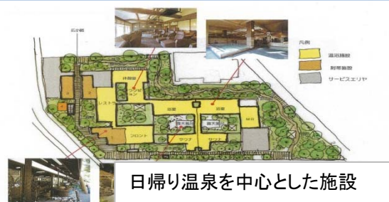
日帰り温泉を中心とした施設