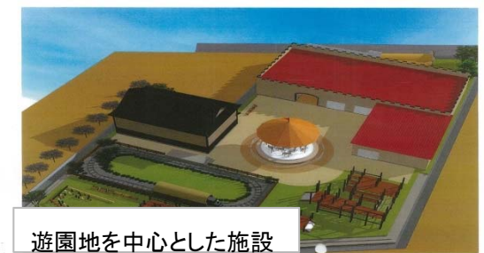
遊園地を中心とした施設