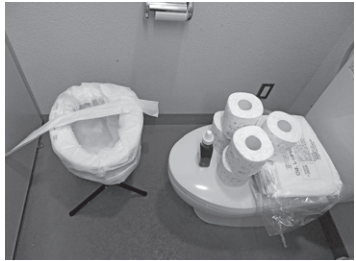
専用の袋を使い、その都度捨てます

訓練中は 実際に簡易 トイレを使 いました。 個室に置か れていたた め、車いす からの移乗 はスペース