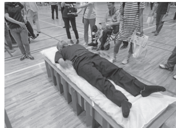
ダンボールの簡易ベッド。寝返りは難しそう…