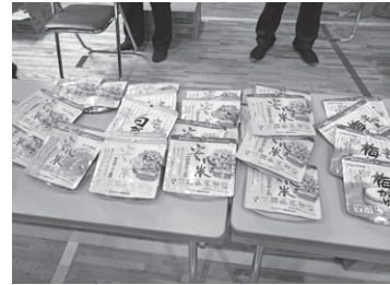
ご飯もさまざまな種類があります

そのまま 食べられる ご飯やおか ず、アレル ギーに配慮 された食品 など、実際 の非常食を 試食できま した。自分たちで用意するときの参 考になりました。