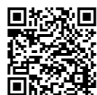
笛吹市 洪水・土砂災害 ハザードマップ